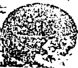
صورة الورقة الأولى من المخطوط (العنوان)